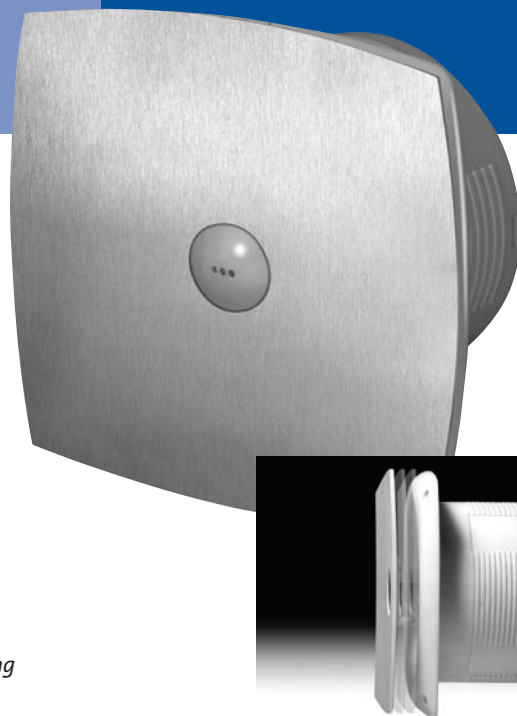
BTV 400 RVS uitvoering

Na uitschakelen draait de ventilator nog een instelbare tijdtijd (45 seconde tot 15 min.) na.